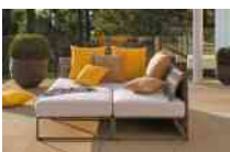
Sifas Paris France