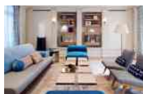
Maison Fred Paris France