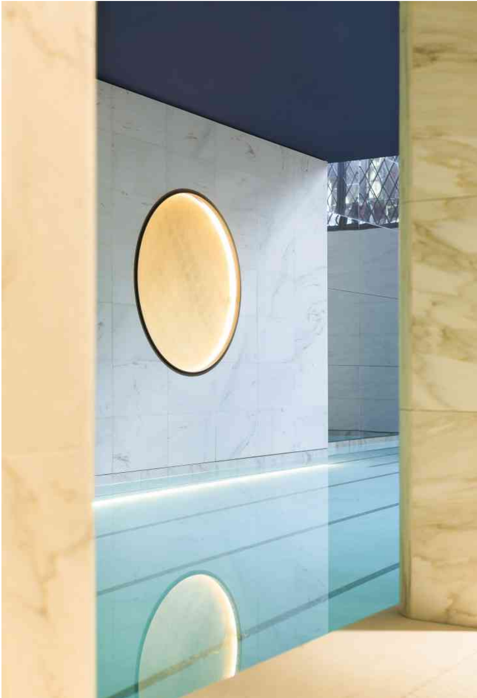
La piscine au sous-sol est baignée de lumière naturelle...