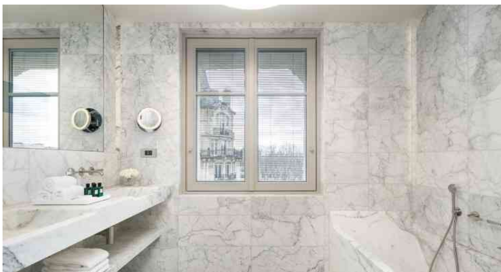
La structure du bâtiment a dû être renforcée afin de pouvoir porter les pièces en marbre des salles de bains. Mathieu Fiol

Restait la restauration des peintures décoratives , des fresques, des mosaïques, qui avaient disparu sous des dizaines de couches de peinture, des sculptures et des vitraux qui font partie de la légende du lieu, sachant que ce dernier oscillait, dès l'origine, entre Art déco et Art nouveau. Un véritable travail d'orfèvrerie afin de changer le décor tout en gardant son esprit.