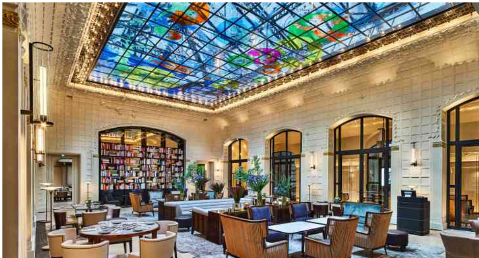
Une œuvre colorée de l'artiste Fabrice Hyber agrémente désormais la verrière du salon Saint-Germain. Mathieu Fiol

Restait la restauration des peintures décoratives , des fresques, des mosaïques, qui avaient disparu sous des dizaines de couches de peinture, des sculptures et des vitraux qui font partie de la légende du lieu, sachant que ce dernier oscillait, dès l'origine, entre Art déco et Art nouveau. Un véritable travail d'orfèvrerie afin de changer le décor tout en gardant son esprit.