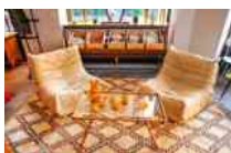
Dallas, Normandie Paris France