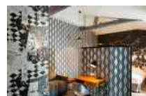
Hôtel Antoine Paris France