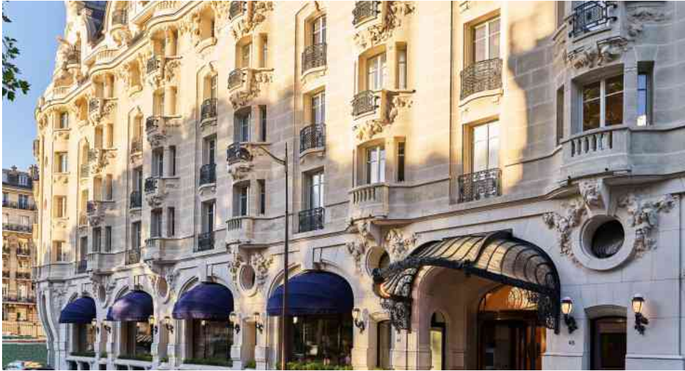
La façade de l'hôtel Lutetia, construite en 1910, a été restaurée à l'identique.

L e travail fut colossal, et finalement payant. Mais il fut surtout architectural car il s'agissait de redonner à ce paquebot échoué boulevard Raspail (et devenu propriété de The Set Hotels), non pas l'élégance qu'il n'avait jamais vraiment perdue, mais surtout sa lumière, afin de l'inscrire dans le catalogue des grands hôtels d'aujourd'hui. Premier impératif, la lumière, donc, qui faisait cruellement défaut. Elle a surtout été retravaillée au rez-de-chaussée par la création, entre autres, d'un patio qui relie le salon Saint-Germain, la bibliothèque et le restaurant L'Orangerie.